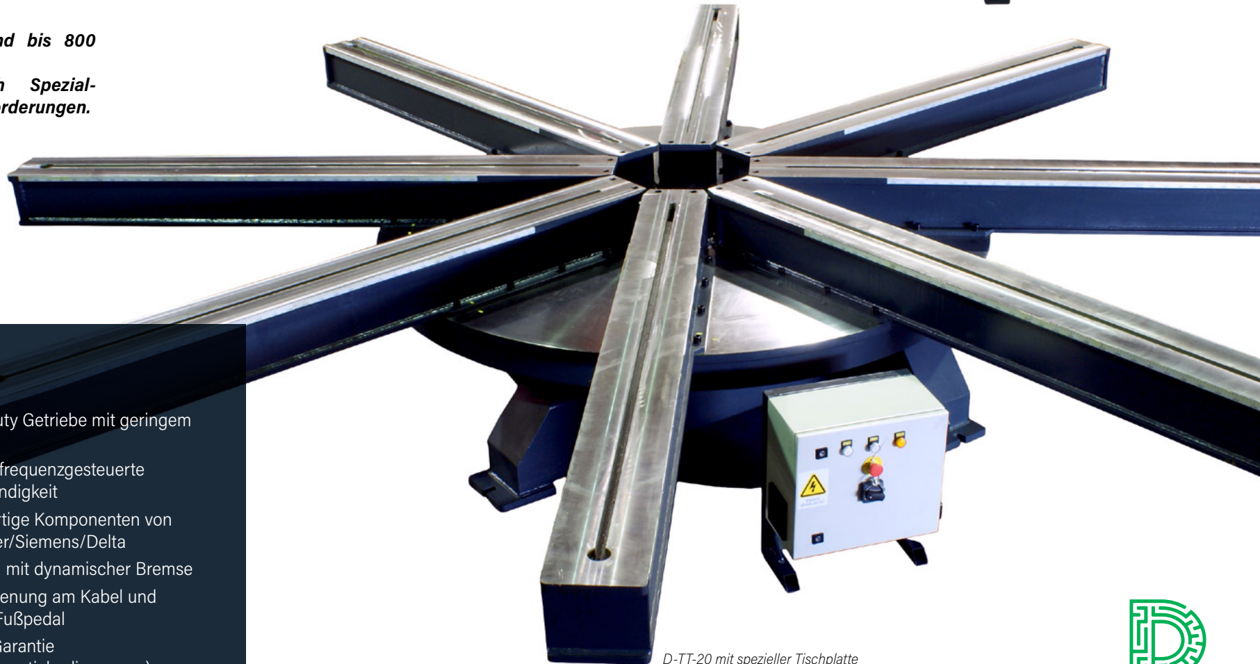
D-TT-20 mit spezieller Tischplatte