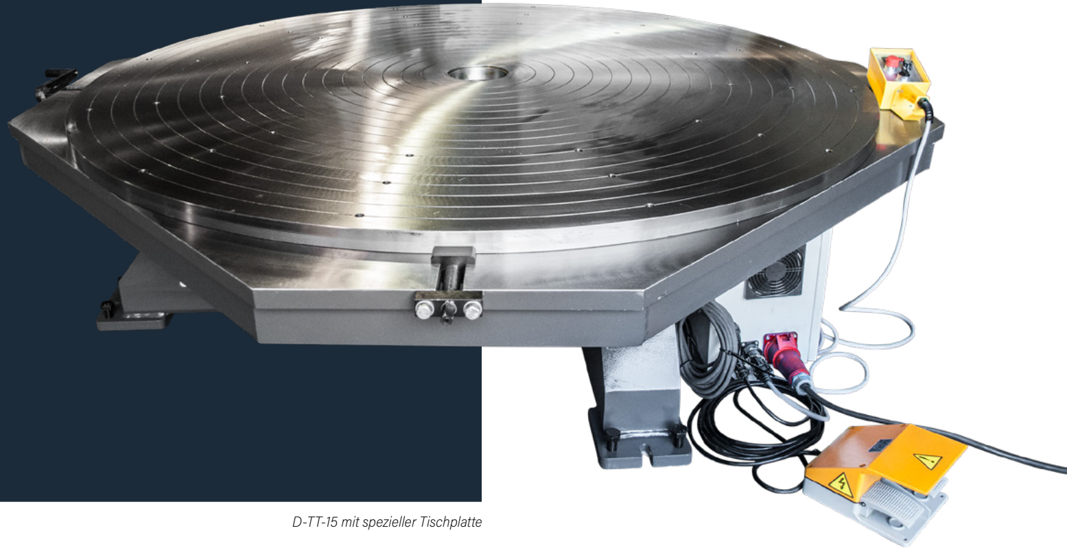
D-TT-15 mit spezieller Tischplatte