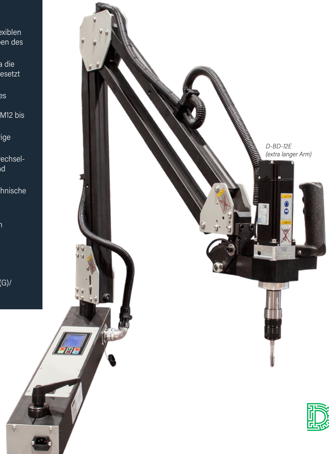
D-BD-12E (extra langer Arm)